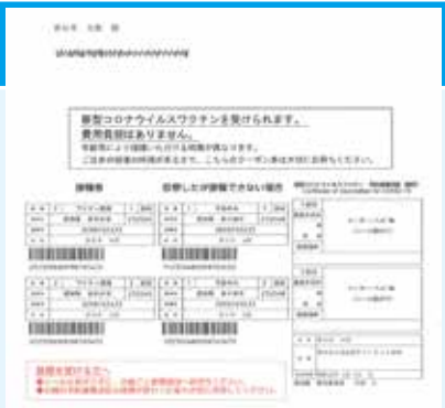
接種券（クーポン券）