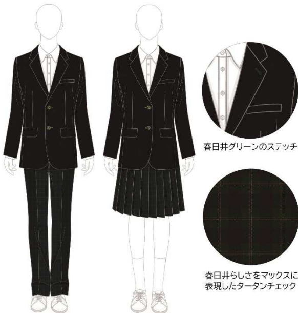
春日井グリーンのステッチ

春日井市のシンボルでもあるサボテンのグリーン、味美二子古墳 の埴輪のブラウン、市花である桜のピンクを取り入れた ”春日井らしさマックス”の制服コーディネートです。 ブレザーにほどこしたグリーンのステッチが元気さ、爽やかさを 印象付けます。