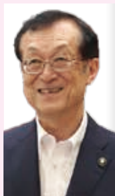
伊藤太春日井市長