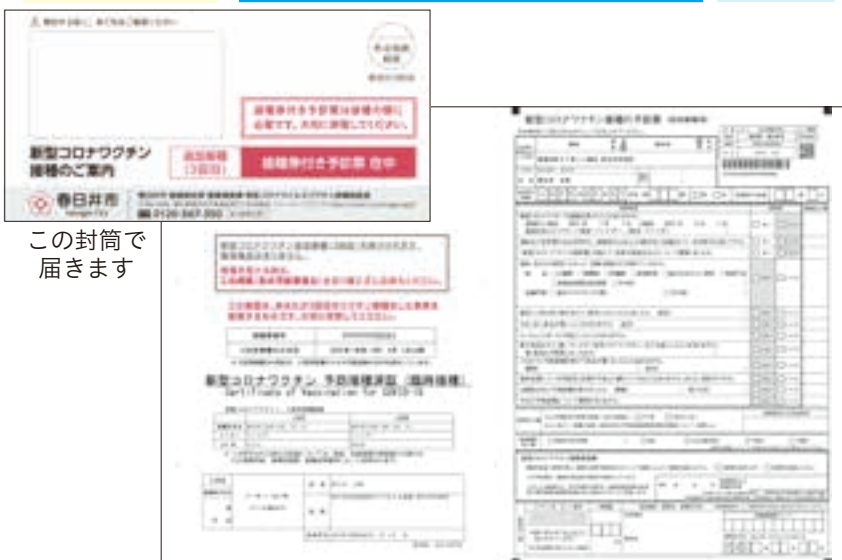
この封筒で届きます