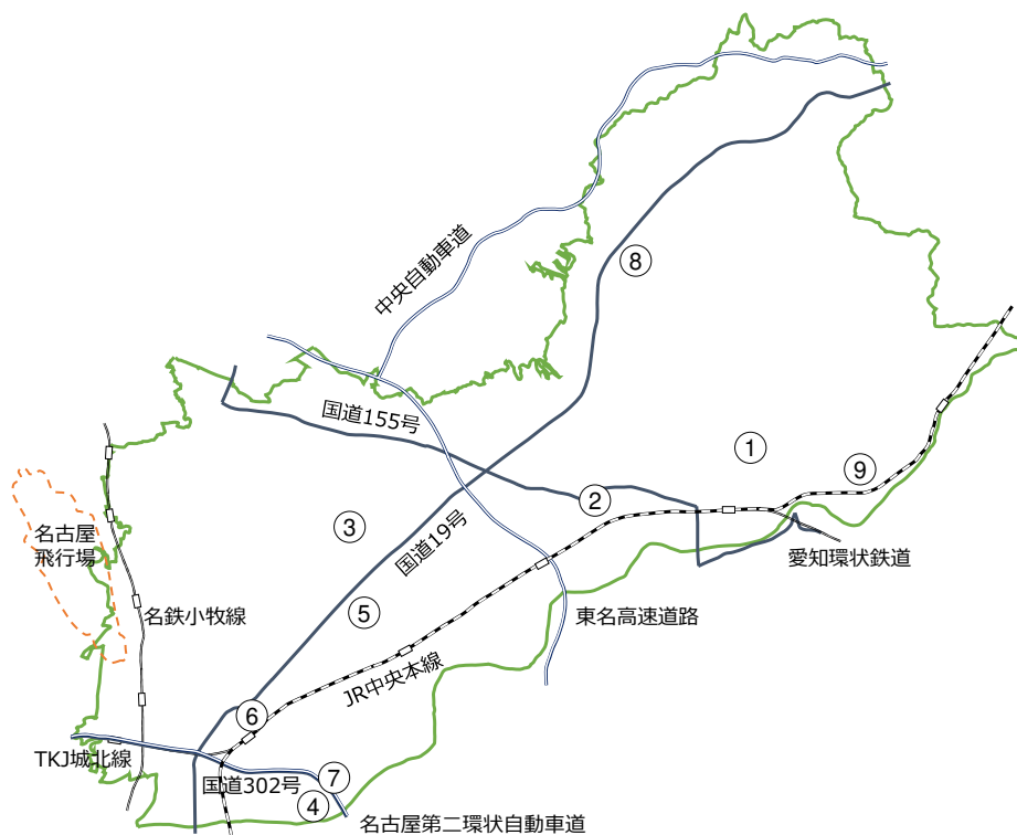
図4-1 環境騒音調査地点

騒音に係る環境基準については、環境庁告示にて地域の類型及び時間の区分ごとに基準値が設定されている。なお、地域の類型指定については、市が都市計画法に定める用途地域に準拠して行っている。