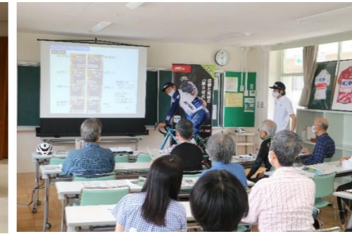
【サイクルスポーツ魅力発見講座】