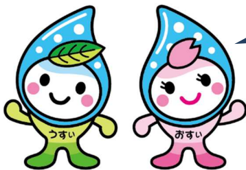
公共下水道事業マスコット