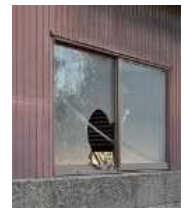
窓が割れた 管理不全空家