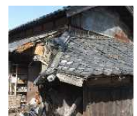
緊急代執行を要する 崩落しかけた屋根