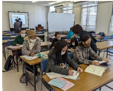
にほんごぎょうしつ しょうす 日本語教室の様子

また、生活に必要な知識(ごみの出し かた こうつうあんぜん ぼうはん ぼうさい 方・交通安全・防犯・防災)を学ぶ機会を ていきょう 提供しています。