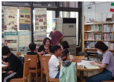
子どもの日本語教室の様子

2023年(令和5年)からは、小学生や中学生だけでなく、4歳以上の子どもも、日本語や日本の文化を学習することが出来るようになりました。