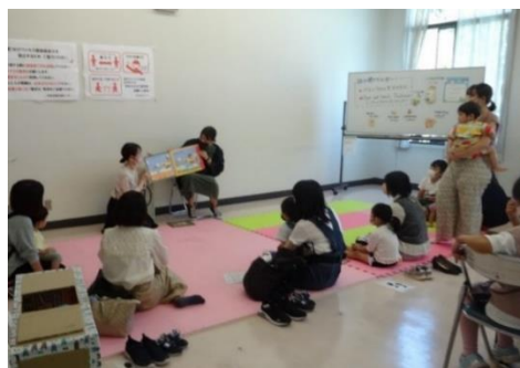
「わくわく!ふれあいワールド」での英語の絵本の読み聞かせの様子

外国の遊びの体験、留学生と一緒に外国の料理を作る料理教室の開催など、外国の文化の紹介をしています。