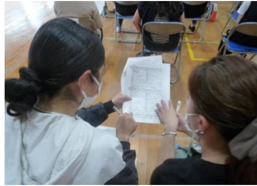
がっこう つうやく 学校での通訳ボランティアの様子

2023年(令和5年)3月現在、通訳ボラン ティアとして、47名が、登録されています。