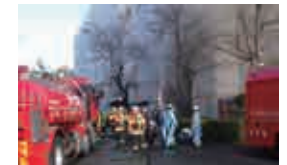
クリーンセンターの火災事故