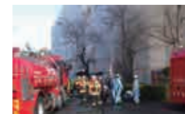
クリーンセンターの火災事故