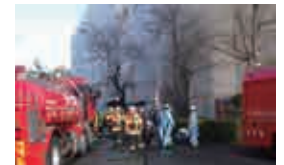
クリーンセンターの火災事故