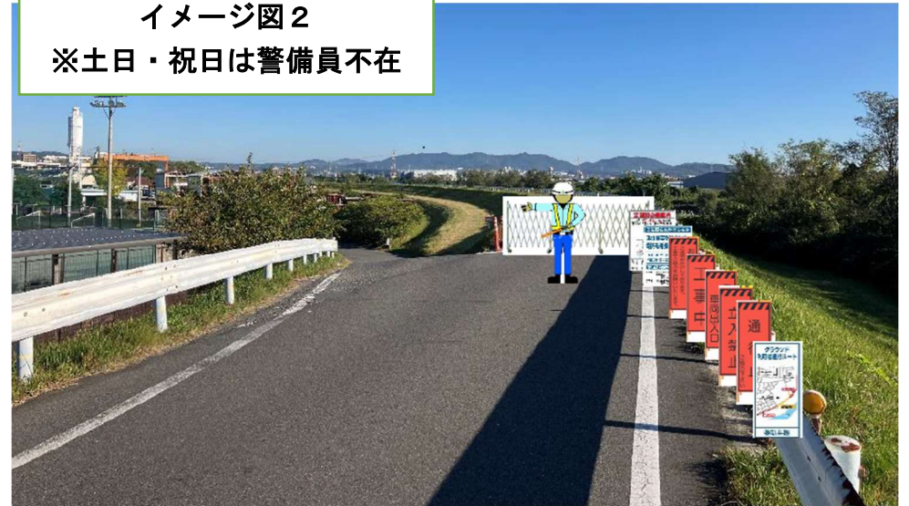
イメージ図 2 ※土日・祝日は警備員不在