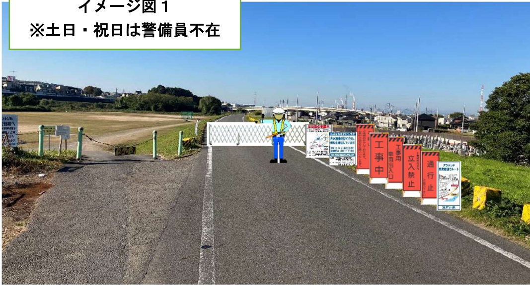
イメージ図 1 ※土日・祝日は警備員不在