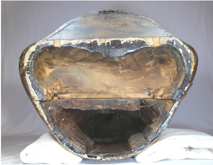
木造阿弥陀如来坐像（像底）