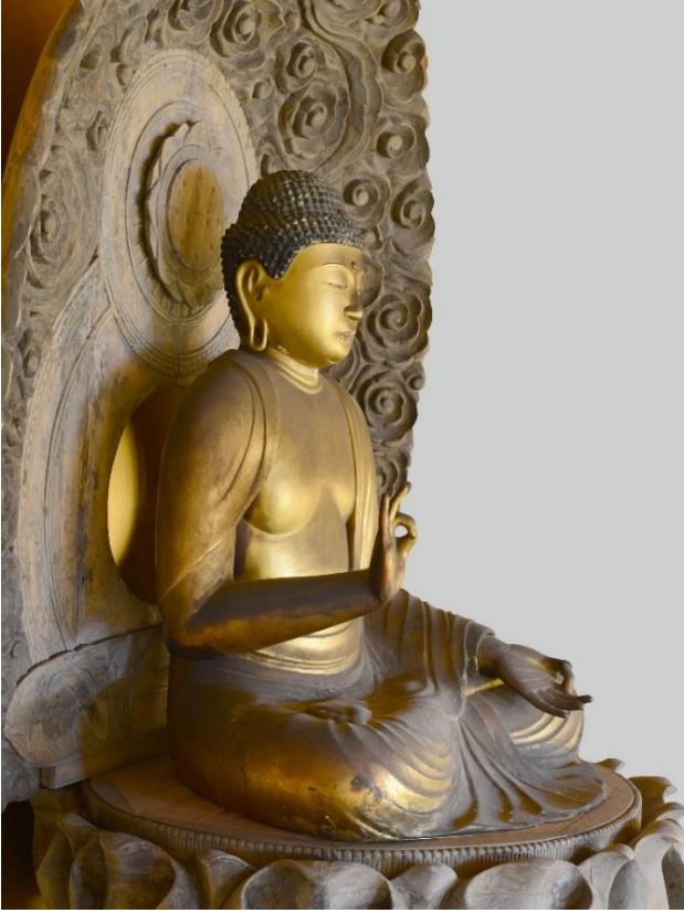
木造阿弥陀如来坐像（右斜側面）