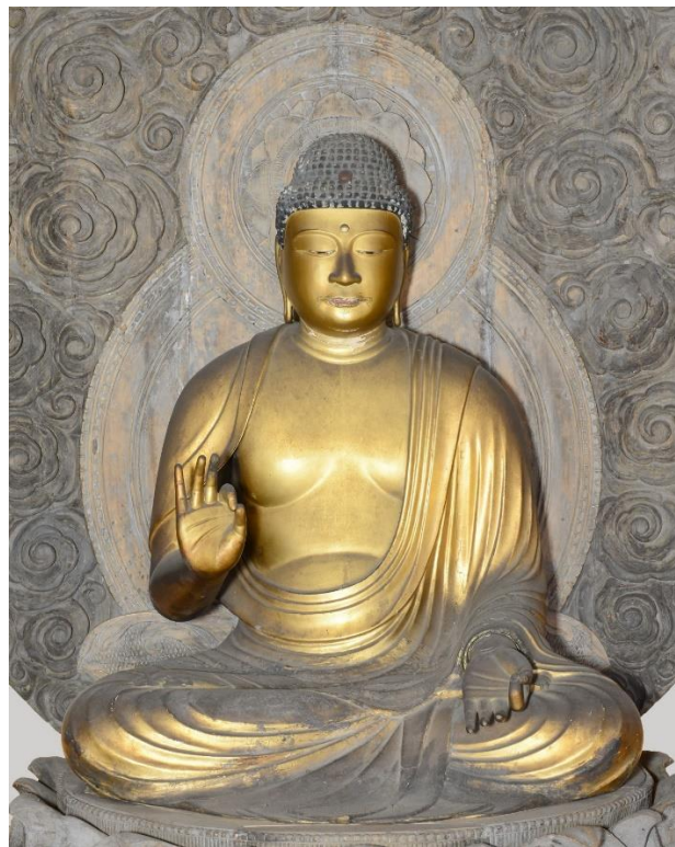
木造阿弥陀如来坐像 (正面)

定朝様 (※) 平安時代の仏師定朝にはじまる和様の仏像彫刻様式で、平安時代後期に流行した。瞑想的な表情、彫りが浅く平行して流れる衣文などに特徴がある。