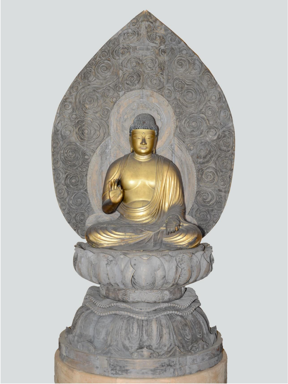
木造阿弥陀如来坐像（全体）