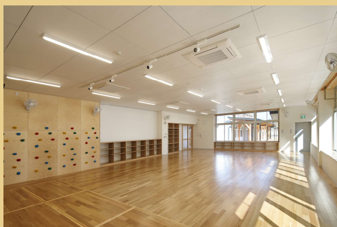
木質化したフローリング