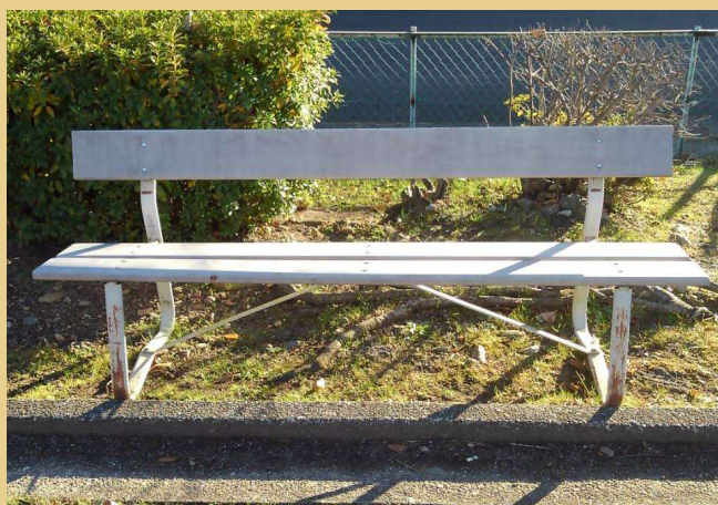
板の交換を行ったベンチ