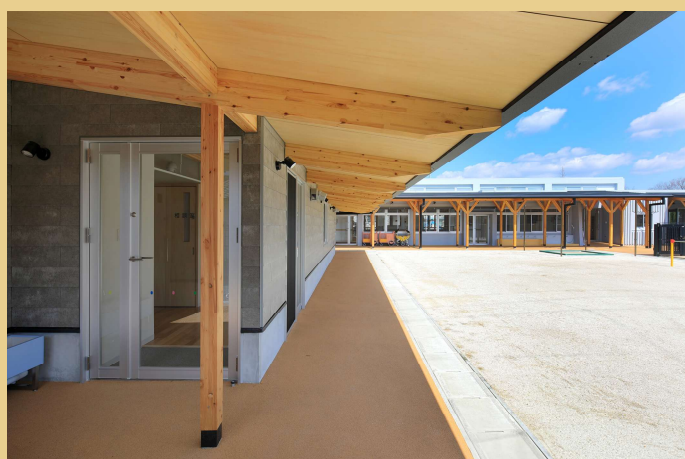
木質化した半屋外空間