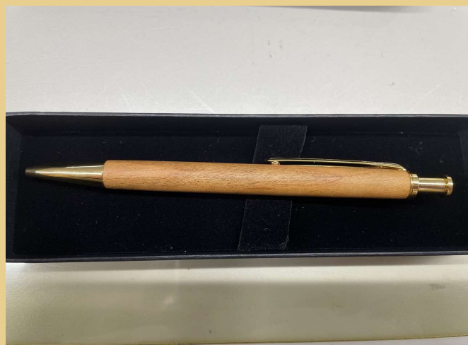
山桜を使用した木軸ボールペン

・カーボンオフセット量（370t-CO 2 ）について、市民が実感しやすい表現として、市内を循環するごみ収集車29台から排出される温室効果ガス1年分に相当とした。