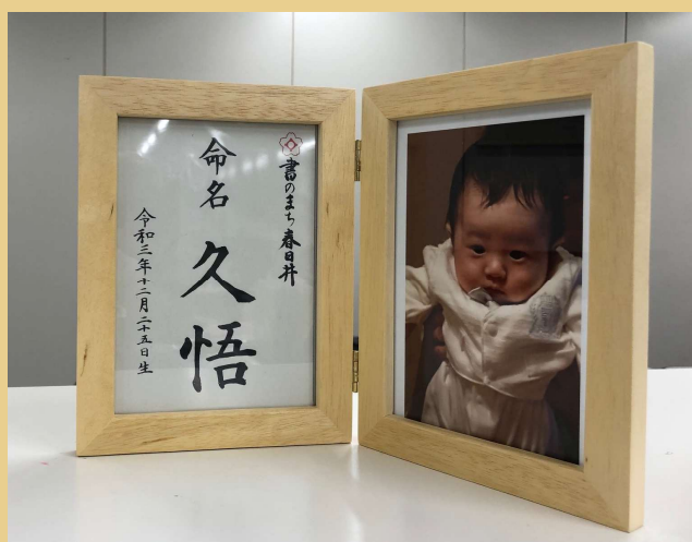
木曽ひのきを使用した写真立て