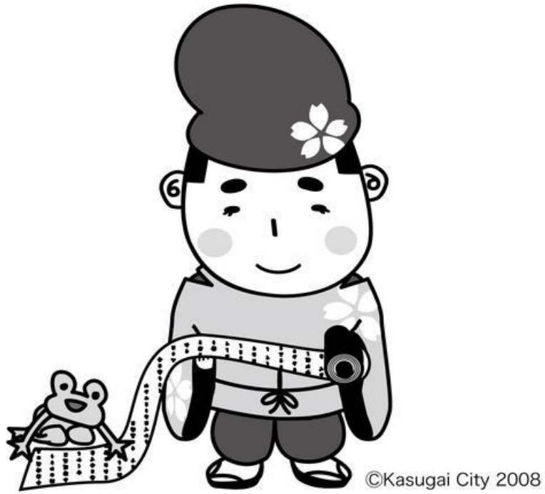
書のまち春日井「道風くん」