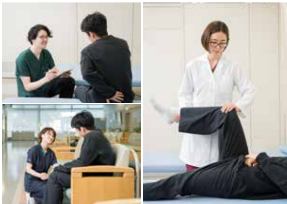
医師や看護師、技師など多職種がチームとなって診療に携わります

※円すい状にX線ビームを照射して撮影するCT検査。短時間で撮影できる上、処置中でも撮影でき、3D画像の構築などが可能です。