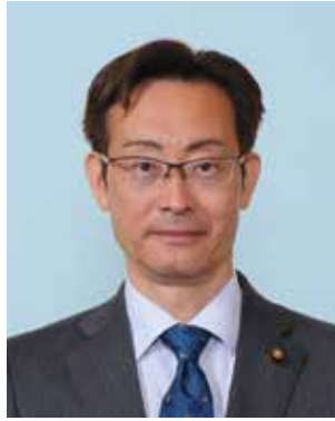
加納 満 議長

5月13日(月)に開かれた市議会臨時会で、議長と副議長の選挙が行われ、議長に加納満議員、副議長に伊藤杏奈議員が選ばれました。