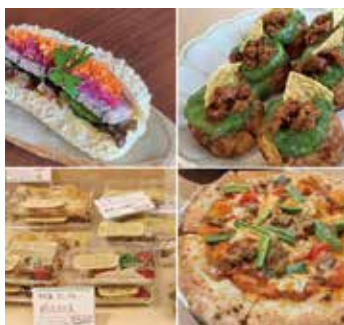
市内飲食店オリジナルのサボテングルメが集結！