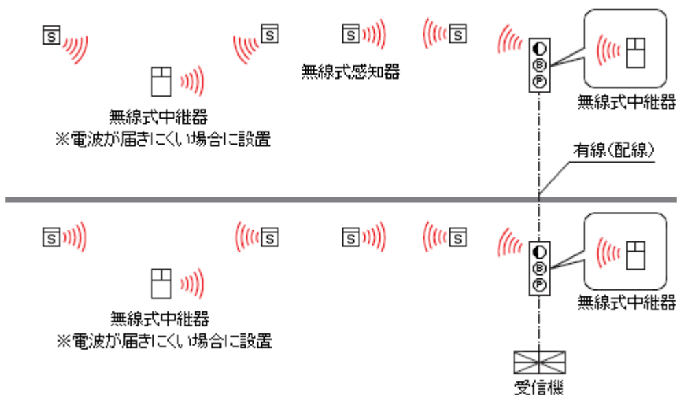
第 10 の 2 - 2 図