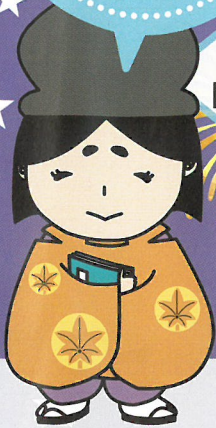
こうぜいくん (和様の書を完成させた 藤原行成がモデル)