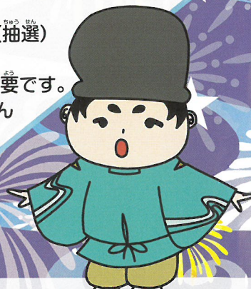
さりくん (和様の書を受けついで 藤原佐理がモデル)

定員 各回 児童16人(抽選) 申し込み 事前申し込みが必要です。 裏面をごらん下さい。