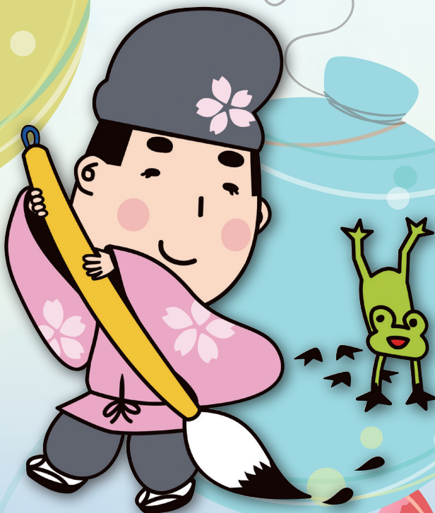
書のまち春日井 マスコットキャラクター とうふうくん (和様の書をつかった 小野道風がモデル)