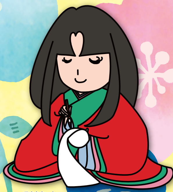
こまちちゃん (小野道風のいとこと 伝わる小野小町がモデル)