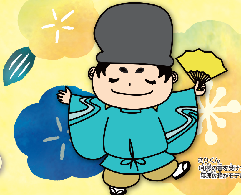
さりくん (和様の書を受けつた 藤原佐理がモデル)

期間中の毎日【小学生対象】 (中学生以上でも参加できます) 申し込みは必要ありません