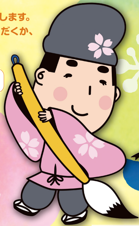
書のまち春日井 マスコットキャラクター とうふうくん (和様の書をつくった 小野道風がモデル)