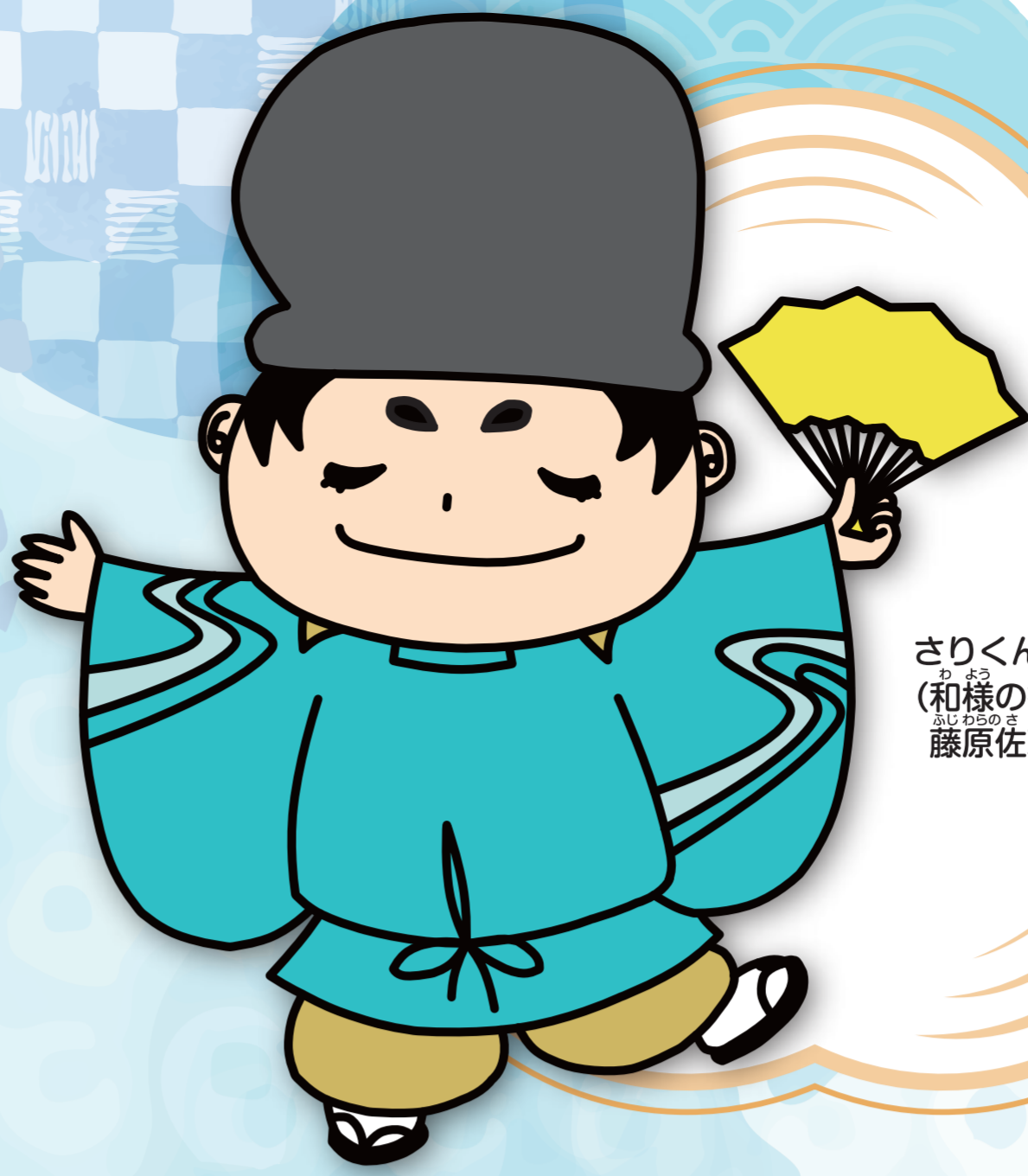
さりくん (和様の書を受けついで 藤原佐理がモデル)

きかんちゅうのまいにち 【小学生対象】 ちゅうがくせい いじょうさんか (中学生以上でも参加できます) もうしこみはひつようありません