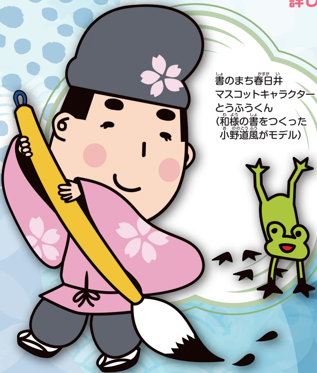
書のまち春日井 マスコットキャラクター とうふうくん (和様の書をつくった 小野道風がモデル)