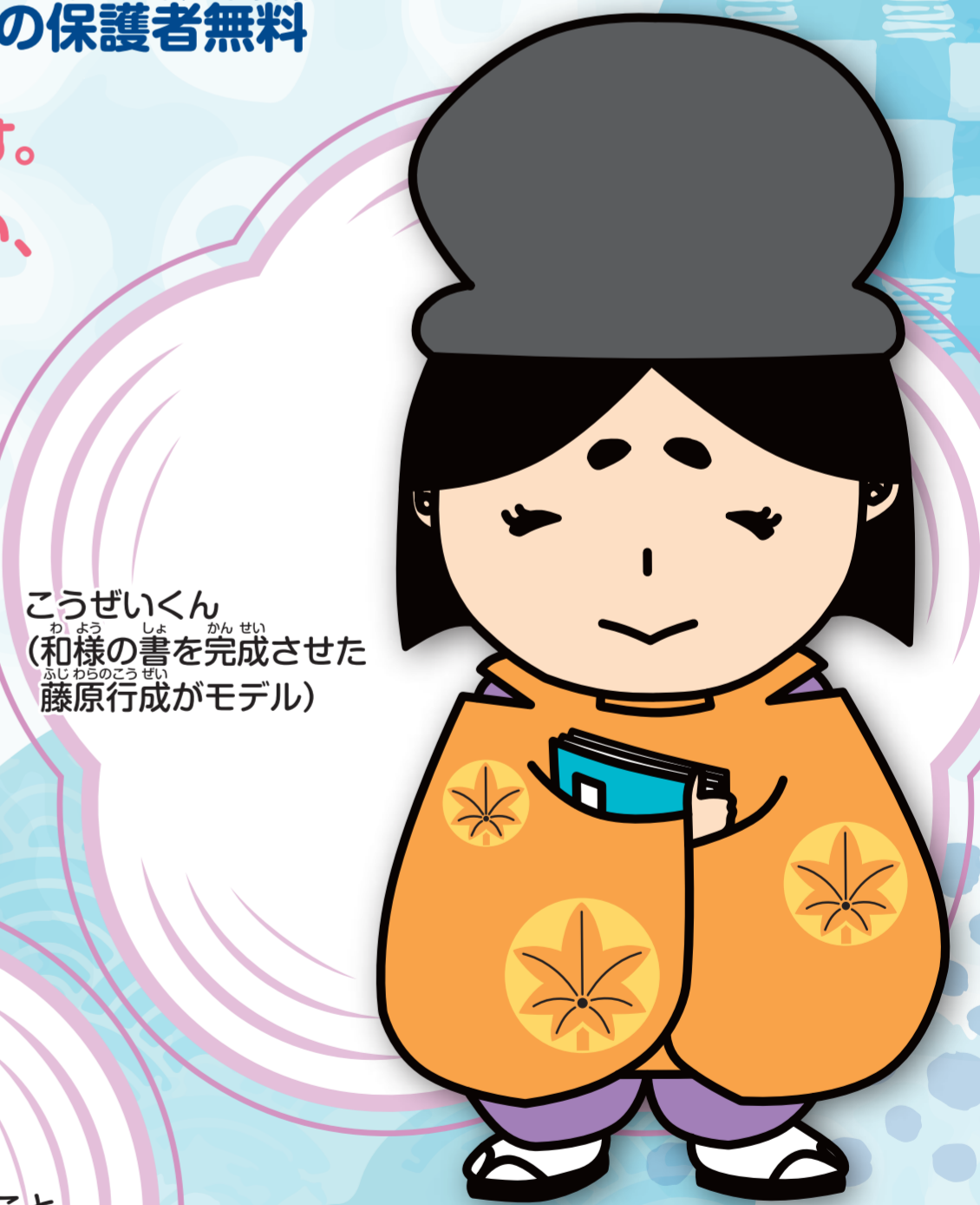
こうぜいくん (和様の書を完成させた 藤原行成がモデル)