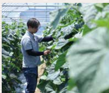
前並町の農場にて。年間50品種ほど栽培しているとのこと。

農業にあまりなじみがない方も、まずは雰囲気味わいに。多くの皆さんに足を運んでいただけたら嬉しいです。